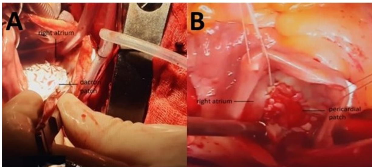
Figura 1. Imágenes de dos pacientes a quienes se les realizó cierre quirúrgico de la CIA, con empleo de parche de dacron (A) o de pericardio (B).

El análisis incluyó a 32 pacientes a quienes se les