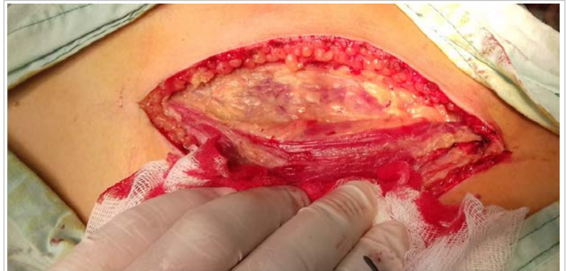
Fig. 2. El borde anterior del músculo dorsal ancho es empleado como marca anatómica, tanto para la incisión en piel como para el abordaje al espacio intercostal.

Un detalle técnico a destacar consiste en la importancia de hacer coincidir la colocación de los separadores costales y la abertura del campo quirúrgico con una óptima relajación muscular del paciente, lo cual requiere un trabajo coordinado con el anestesiólogo. Esta maniobra disminuye considerablemente la incidencia de fracturas costales y aunada a la habitual colocación de almohadillas de gaza sobre las partes óseas, también contribuye a evitar lesiones del paquete vasculo-nervioso subcostal ( Fig. 4 ).