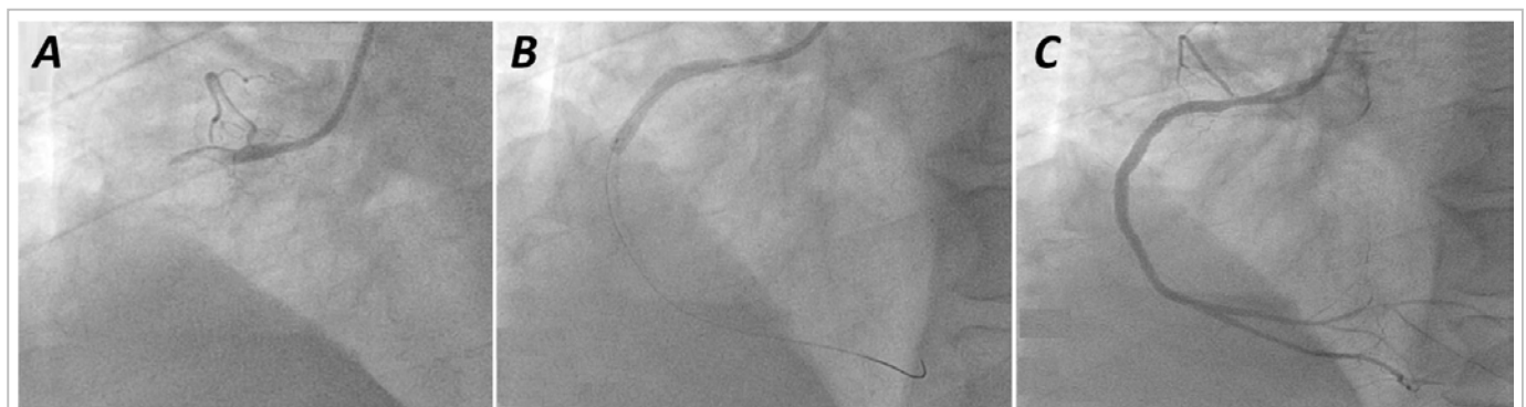
Figura 2. A. Proyección angiográfica oblicua anterior izquierda de 30° donde se visualiza la oclusión total proximal de la coronaria derecha. B. Implantación del stent . C. Resultado angiográfico.

Es oportuno comentar que los SLF, pese a tener ventajas notables en relación a la aparición de trombosis, en comparación con los SMC, son igualmente susceptibles a la causa multifactorial. No obstante, es posible la asociación de nuevos factores relacionados, al tener en cuenta la relativa complejidad de estos dispositivos: plataforma metálica (material, geometría, grosos de filamentos), polímero (composición, disposición, grosor, biocompatibilidad, trombogenicidad, potencial proinflamatorio,