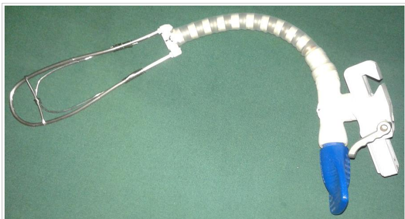
Fig. 2. Uno de los separadores fabricados por nuestro equipo.

gran variedad de separadores esternales empleados durante la disección mamaria. Puede resultar conveniente fabricarlos en varios tamaños para que se puedan ceñir a diferentes situaciones anatómicas, pero hemos fabricado al menos uno en el que la varilla metálica curva («valva») puede deslizarse a través de los soportes plásticos del brazo articulado, lo que le permite variar su extensión ( Fig. 3 ). Una vez que el separador ha sido adecuadamente fijado a una estructura rígida, el cirujano puede posicionarlo de forma conveniente para que no interfiera con su maniobrabilidad ( Fig. 4 ). Debe recordarse que se coloca casi exclusivamente cuando la disección de los segmentos proximales de la mamaria se ve entorpecida por la expansibilidad pulmonar, por lo que con solo unos pocos usos, el cirujano es capaz de predecir con facilidad la posición más ventajosa que le permitirá concluir el procedimiento sin mayores contratiempos.