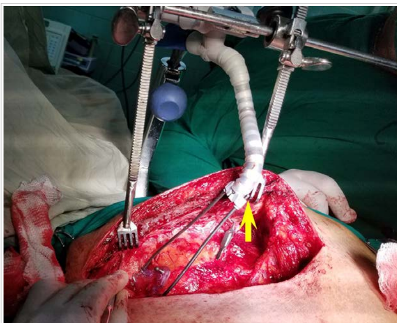
Fig. 3. Separador facilitando la disección del segmento proximal de la arteria mamaria izquierda. Obsérvese que la varilla curva en forma de «valva» puede deslizarse a conveniencia del cirujano (flecha), lo que modifica el alcance del separador. En este paciente, el extremo distal de la mamaria ha sido pinzado al inicio de la disección, en consonancia con el nuevo método de disección mamaria propuesto por el autor principal de este artículo.

Un dispositivo ajustable que asuma la separación de estructuras anatómicas siempre racionalizará la utilización del personal del equipo quirúrgico en cualquier intervención; en nuestro caso, al eliminarse la necesidad de que una enfermera deprime el pulmón durante la preparación del segmento proximal de la mamaria, se optimiza su función de instrumentista para apoyar la extracción