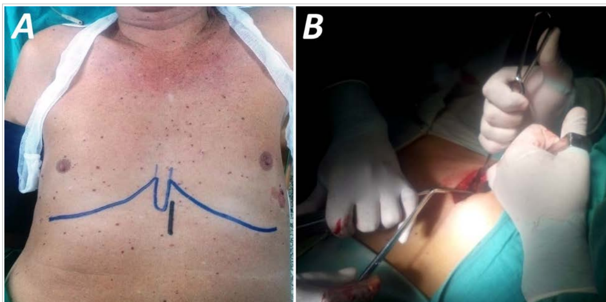
Fig. 1. A. Esbozo preoperatorio de la localización de la pequeña incisión en una línea paraxifoidea izquierda. Posteriormente, la tracción y elevación de los bordes de la herida, permitirá prolongar la disección hasta el último ángulo costo-esternal sin necesidad de ampliar la incisión cutánea. B. El empleo combinado de aspiración y movilización de la grasa pre-pericárdica, mientras se extrae con pinzas Allis, ha resultado una estrategia efectiva en los pacientes. Esta maniobra puede concluir con la sujeción del pericardio con la pinza, si no está demasiado tensionado.

Un aspecto importante de la técnica consiste en desalojar la capa de grasa mediastinal subxifoidea 18 que descansa sobre el pericardio para permitir su adecuada sujeción. Para esta maniobra no se ha descrito un instrumental específico 19 , puede realizarse con la cánula de aspiración, con una pinza larga protegida con gasa, o desgarrando el tejido adiposo con una pinza Allis o de anillo. Una vez que ha quedado descubierto un pequeño segmento del pericardio, el siguiente paso es asirlo para abrirlo de manera controlada. Una forma bastante sencilla de facilitar este procedimiento consiste en anclar el