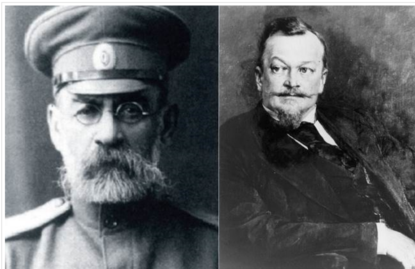
Figura 4. Vasily Ivanovich Razumovsky o Victor von Hacker. ¿Quién fue el verdadero creador de la mediastinotomía superior? Tomadas de: Andreev AA, Ostroushko AP. Vestnik Eksperimental'noj i Kliničeskoj Hirurgii. 2017 23 .

En 1888, Ivan Ivanovich Nasiloff (1842-1907) en San Petesburgo, después de experimentar en cadáveres, propuso una incisión posterior para la remoción de cuerpos extraños, tumores y estenosis cicatriciales en la porción torácica del esófago 30,31 . Erróneamente se ha planteado que lo descrito por Nasiloff fue una toracotomía posterolateral 32 ; es posible que la confusión se deba a algún antiguo error de traducción.