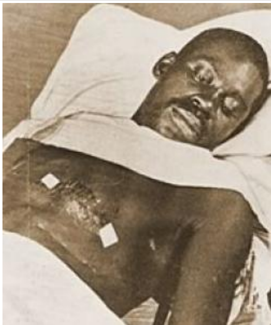
Figura 5. La incisión realizada por Daniel Hale Williams debe considerarse la primera toracotomía anterolateral izquierda en el quinto EIC, para abordar una herida cardíaca.

por algunos investigadores, como se analizará en la tercera parte de esta revisión.